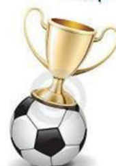
تابستان ۹۴ مساجد تحت پوشش طرح فعالان فرهنگی قلعه گنج