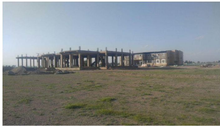
تصویر آخرین وضعیت فاز دوم و چهارم (خوابگاه مدرسه)