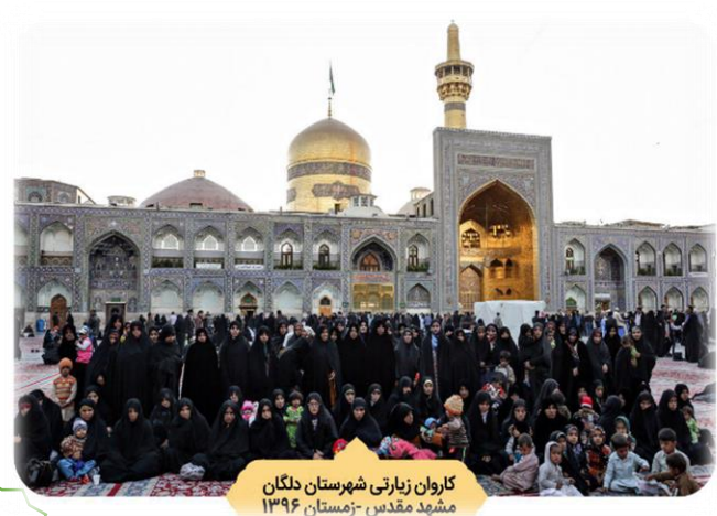
کاروان زیارتی شهرستان دلگان مشهد مقدس - زمستان ۱۳۹۶